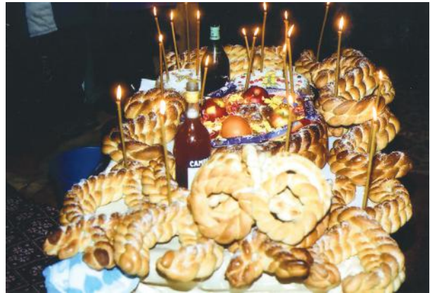
Masa cu capete.