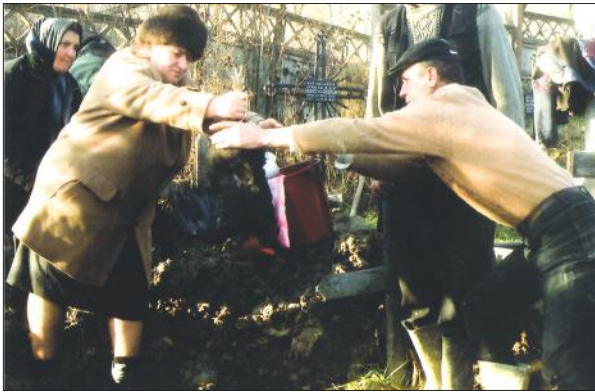
Ritualul datului găinii negre și al găleții peste groapă.