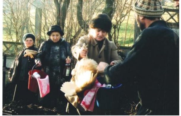
Ritualul datului găinii albe și al găleții peste groapă.