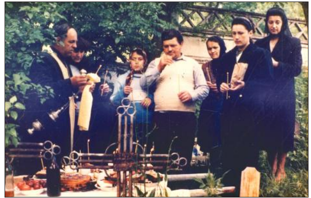
Pomană rituală după un an, la mormânt.