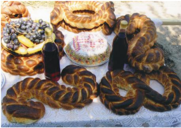
Capete, coliva și colacuș parastas.